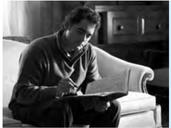
Malek Jandali

Das Hauptthema des dritten symphonischen Tanzes leitet sich vom Ardah ab, einem traditionellen Schwerttanz der Männer, der von Trommeln und