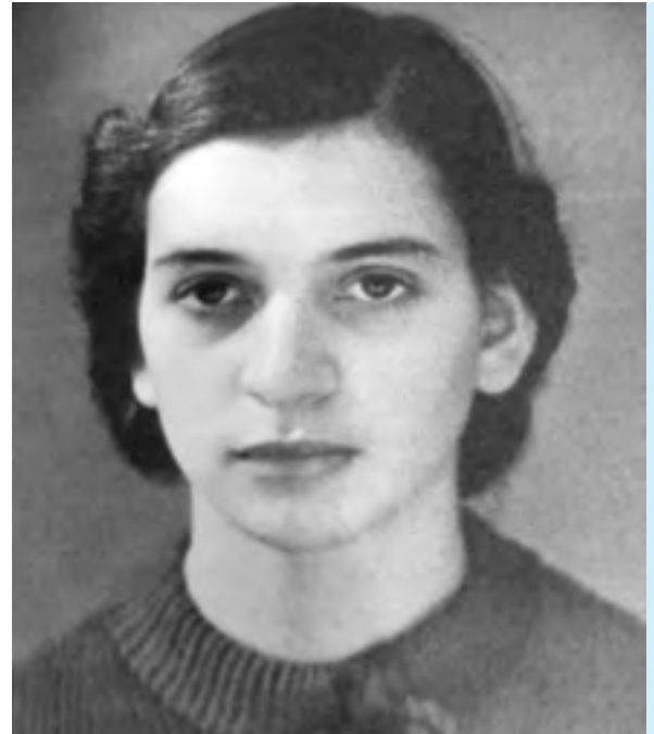
Ursula Mamlok 1938 in Berlin – kurz vor ihrer Flucht im Februar 1939 nach Guayaquil (Ecuador)

Vielleicht liegt darin eine der zentralen Ideen des Werks: Menschlichkeit ist keine Frage des Systems, sondern eine individuelle Entscheidung, die von jedem getroffen werden kann – sie ist überall zu finden!